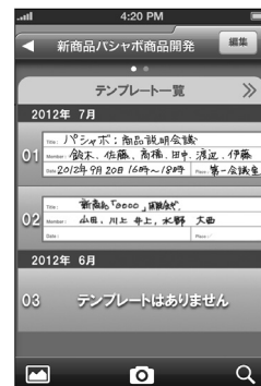
テンプレートシート上の項目のみの表示も可能